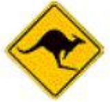
Road signs in Australia

(注) Ayers Rock: エアーズロック hill: 丘 cave: 洞窟 the Aborigines: オーストラリアの先住民 holy: 神聖な koala: コアラ in the wild: 野生の road sign: 道路標識